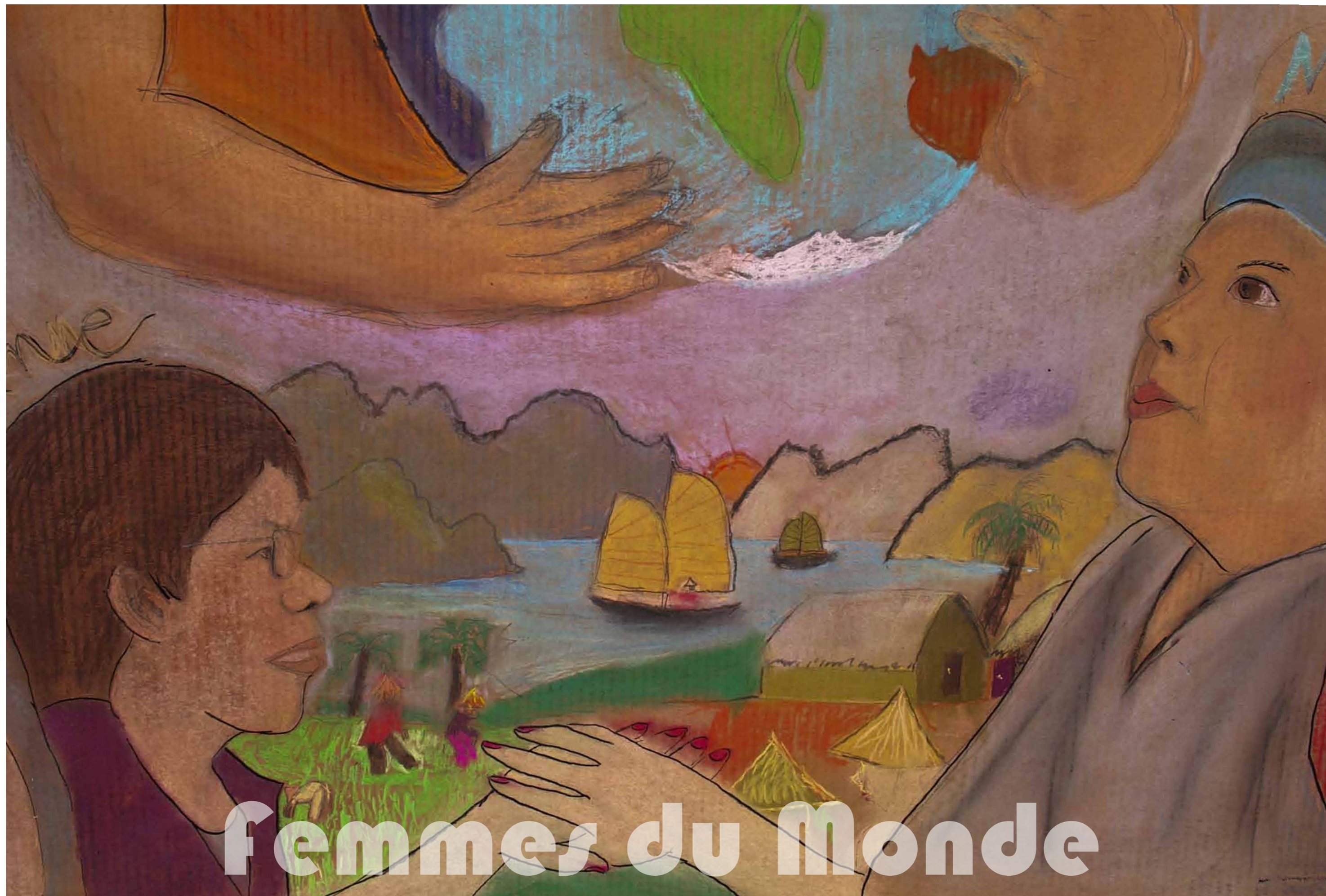
Compte rendu de l'atelier artistique de portraits à la Maison pour tous de FONTBARLETES (Valence) / Antoine Louisgrand / Juin 2013