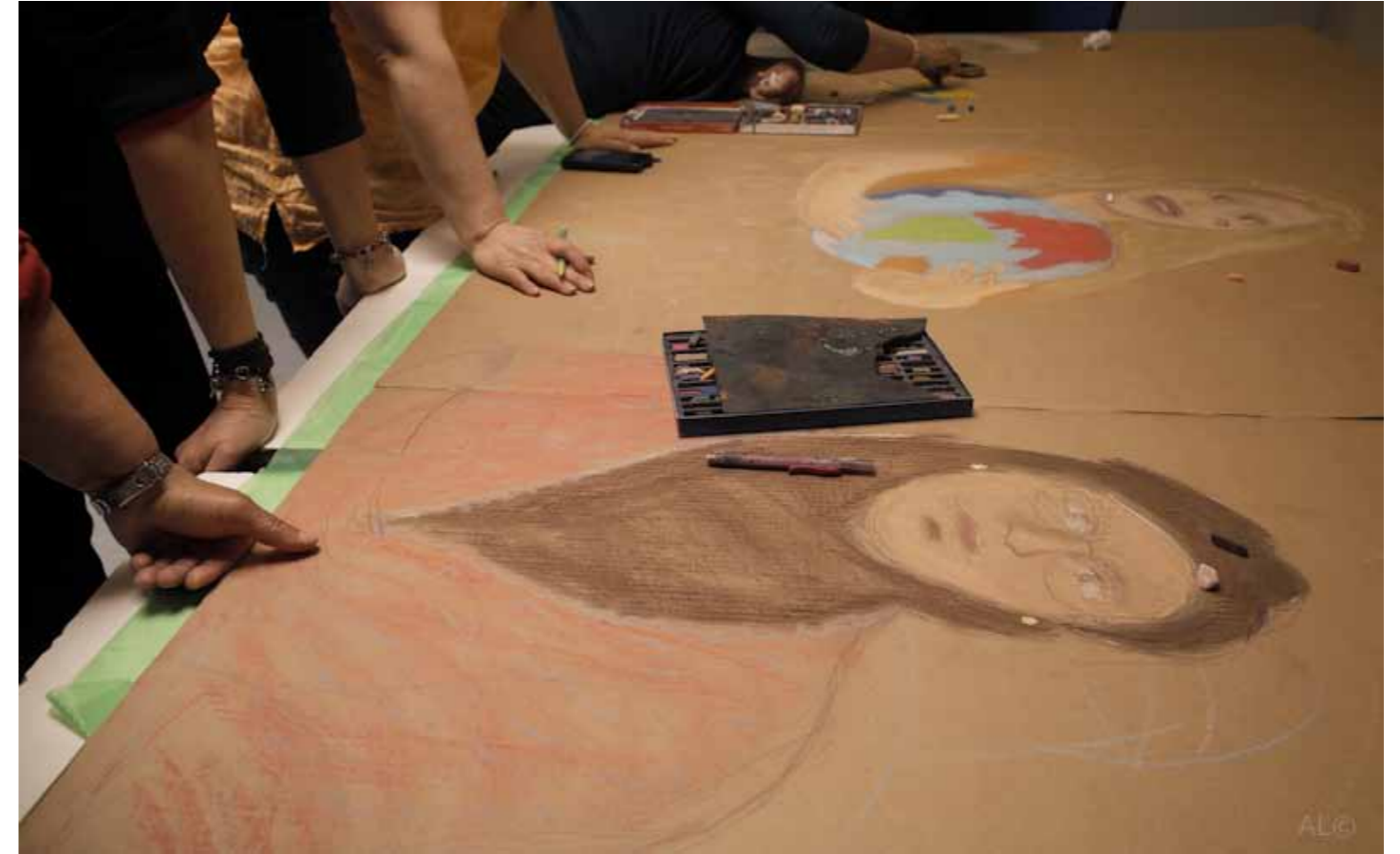
2 .Sur la thématique du portrait, nous entamons une fresque où les femmes trouvent leur place en dessin, sur une feuille de carton de 3 m x 1,50 m. Chaque participante mime une expression que je retranscris sur le carton, parmi les portraits déjà existants.