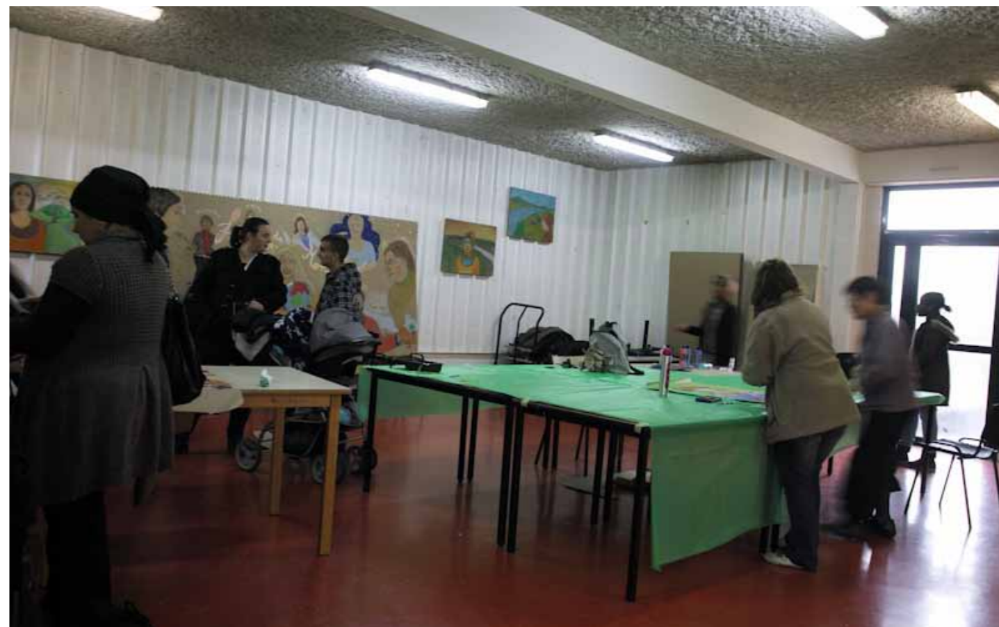
5 . Nous réalisons une fresque des enfants sur un grand carton de 3 m x 1,5 m et je dessine des portraits de famille à main levée. Devant le succès de cette animation, j'ai très peu de temps pour récolter des traces photographiques.