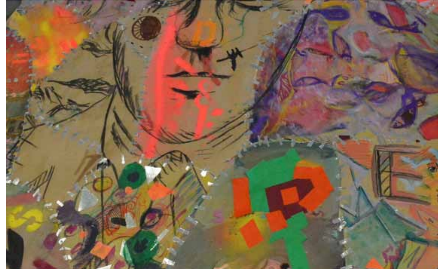
3. Après une heure d'expression et d'expérimentations diverses, nous reconstituons le dessin et en relient les éléments avec du scotch.