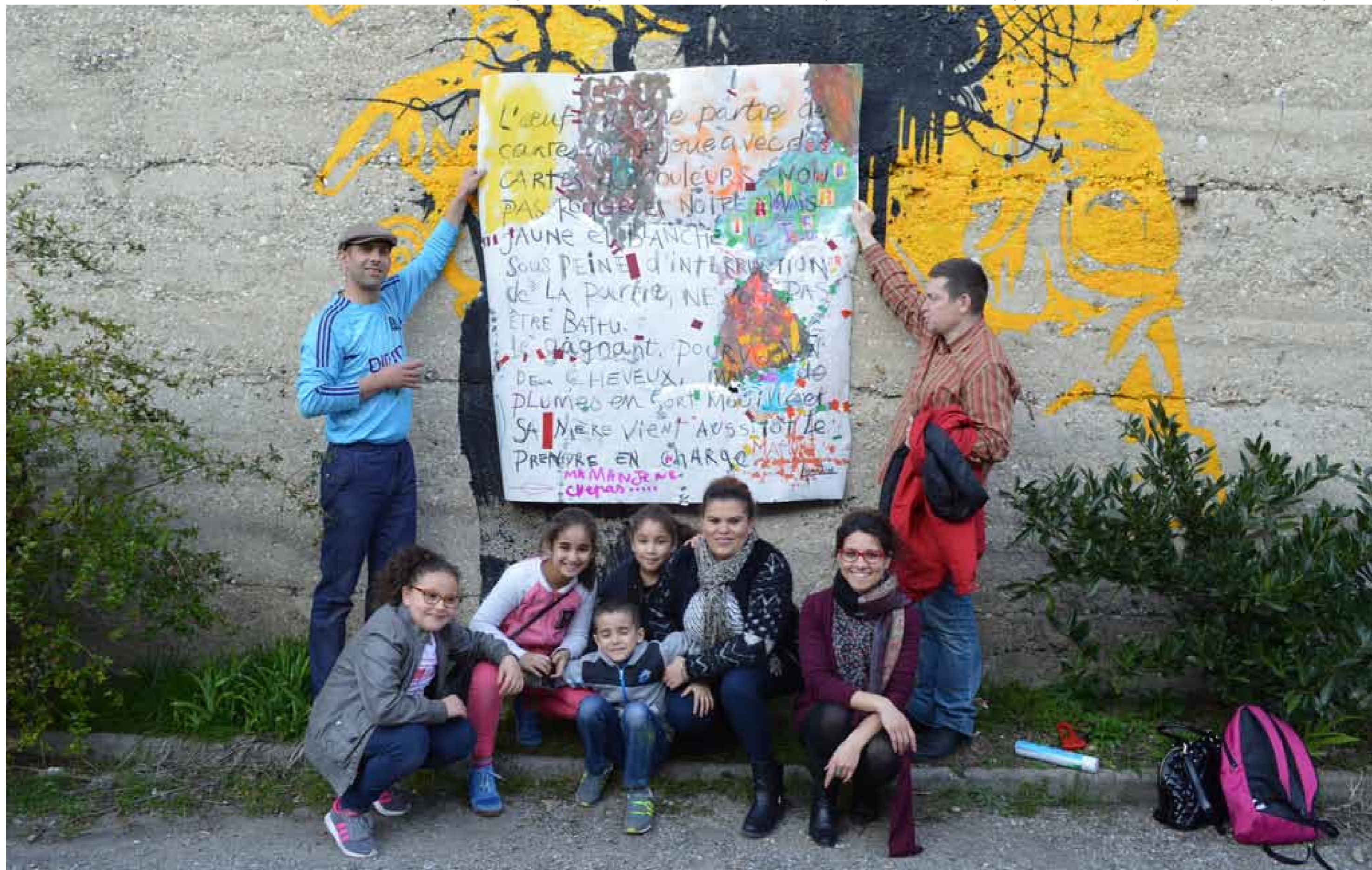
4. Photo de famille avant d'exposer le cadavre exquis au public. Remerciements à l'Association Pandora pour son invitation, ainsi qu'aux enfants et aux adultes participants qui se sont prêtés au jeu de la création.